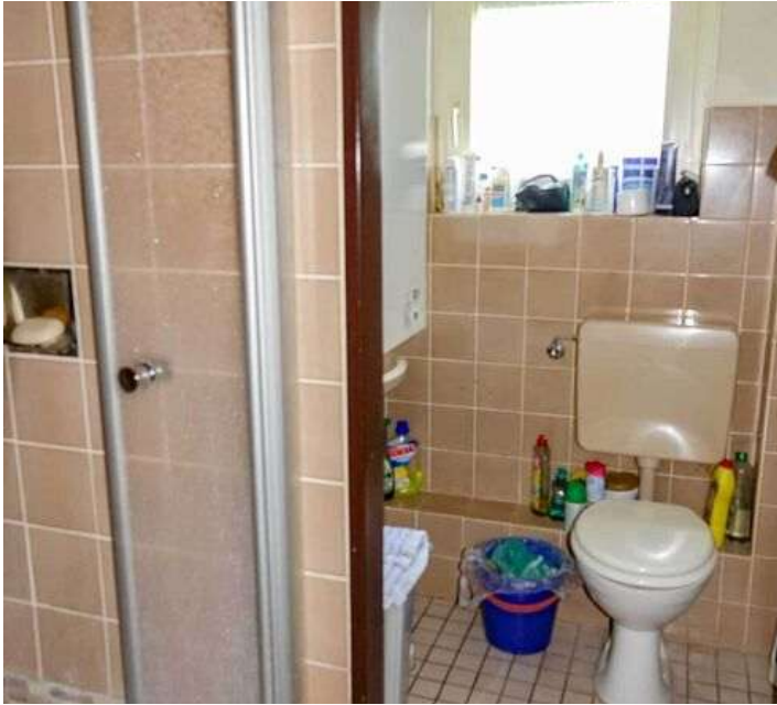
Bad EG Mitte