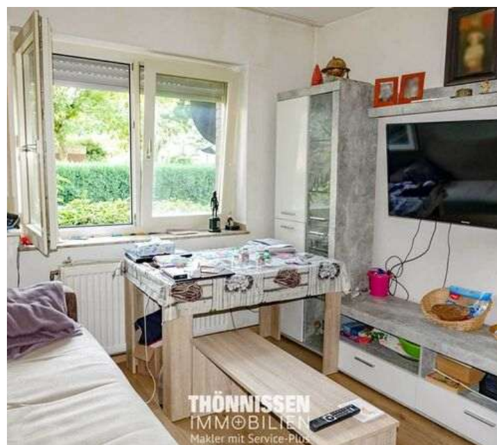
Wohnbereich EG Mitte