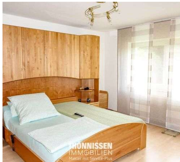
Schlafzimmer EG rechts