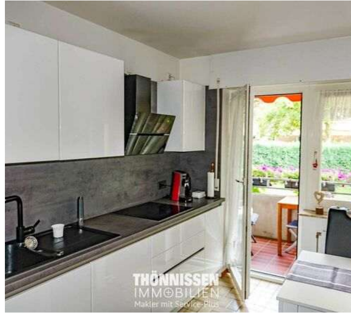
Küche EG rechts