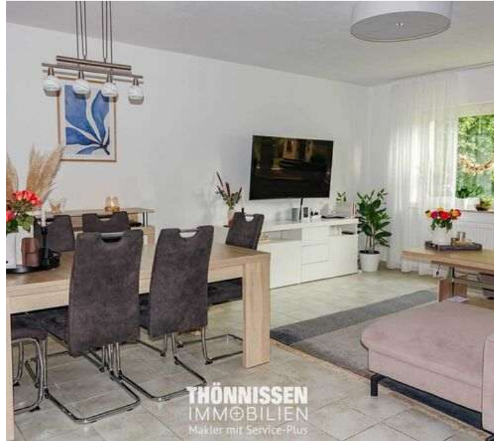
Wohnbereich OG links