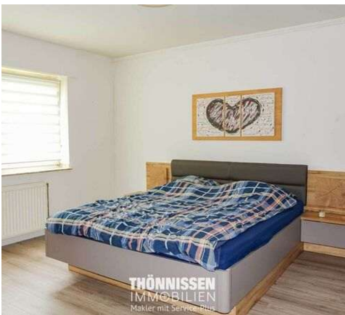
Schlafzimmer EG links