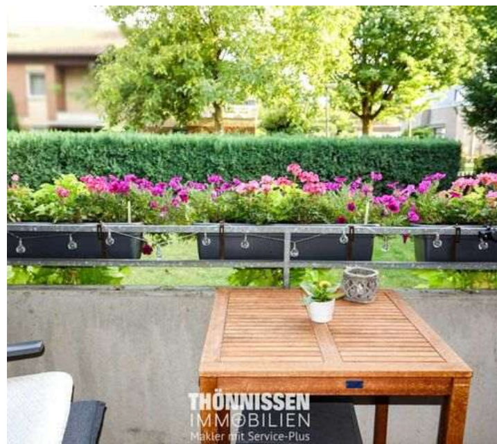
Balkon EG rechts