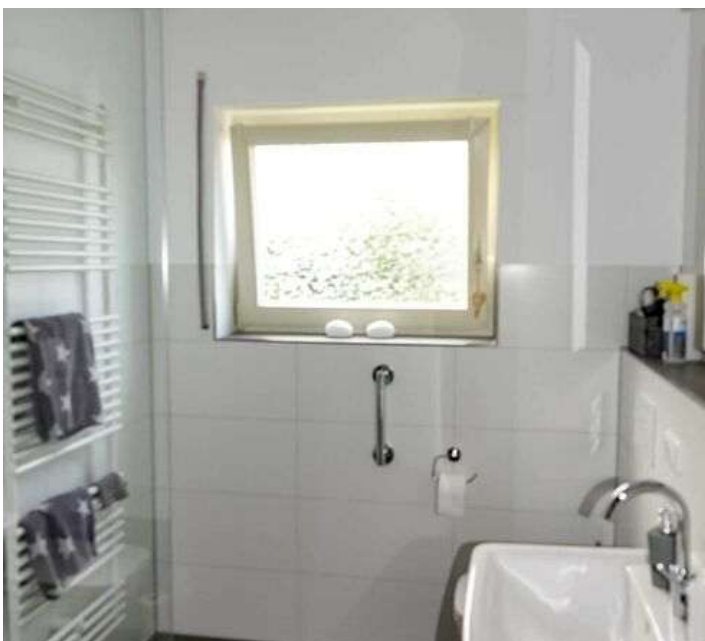
Bad EG rechts