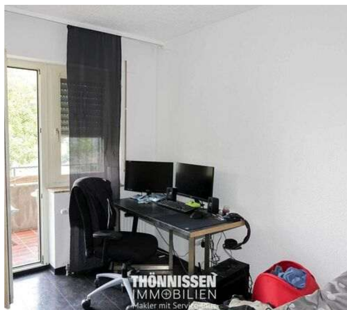
Schlafzimmer OG Mitte