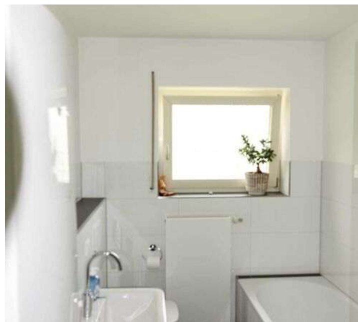
Bad EG links