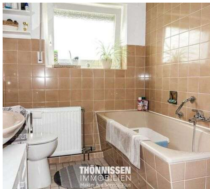
Bad OG links