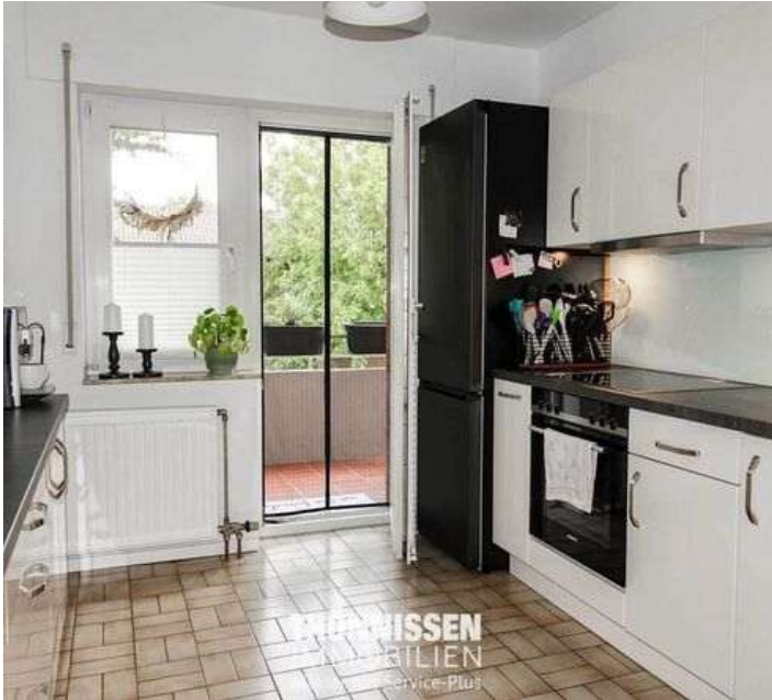
Küche OG links