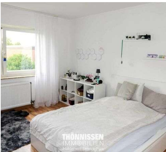
Schlafzimmer OG links