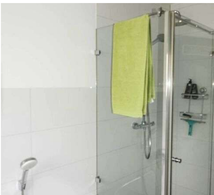
Bad EG links