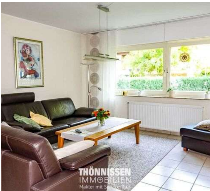
Wohnbereich EG rechts