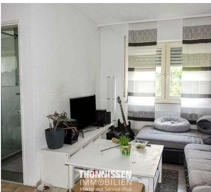
Wohnbereich OG Mitte