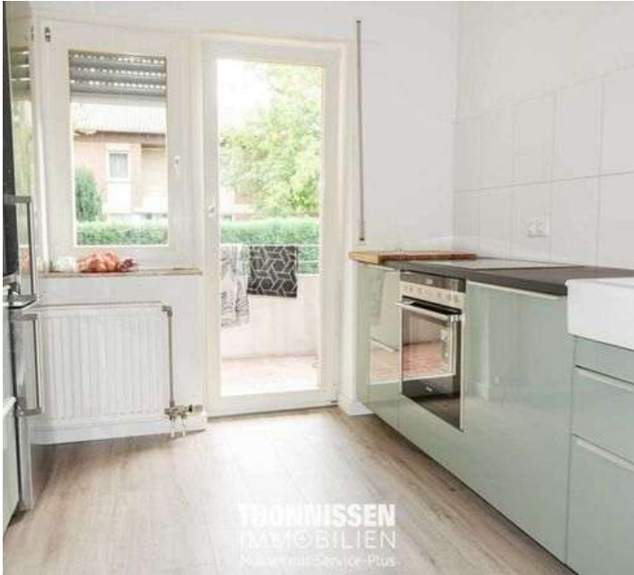
Küche EG links