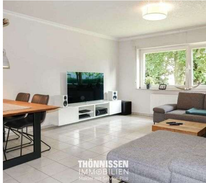
Wohnbereich EG links